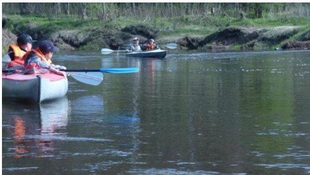
7. Прохождение трубы газопровода. 7.05.18