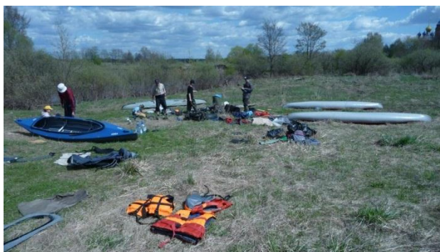
11. Антистапель в с. Лахость. 8.05.18