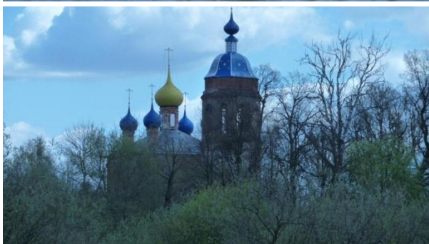
10. Церковь в с. Лахость. 8.05.18