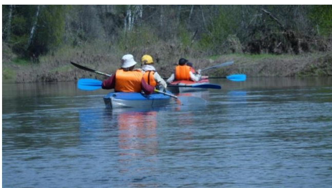
9. Лахость в районе д. Рохмала 8.05.18