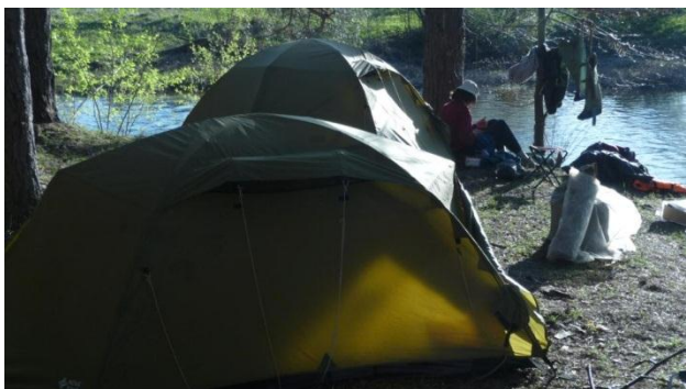
8. Последний бивак. 7.05.18